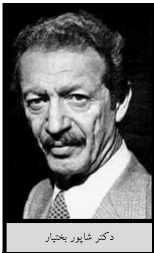
دکتر شاپور بختیار

بود هر ایرانی که موفق به اجرای این حکم در یک کشور خارجی شود به عنوان عامل اجرای حکم دادگاه محسوب خواهد شد. ۳۵۶