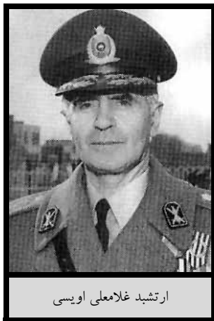
ارتشبد غلامعلی اویسی

در روز ۱۸ بهمن ۱۳۶۳، ارتشبد غلامعلی اویسی و برادرش غلامحسین اویسی در یکی از خیابانهای پاریس از فاصله نزدیکی در ناحیه سر مورد اصابت گلوله قرار گرفتند. ۱۷۲ هر دو بلافاصله جان سپردند. ۱۷۳ پلیس فرانسه مردان مسلح مسئول را قاتلان حرفه‌ای توصیف کرد. ۱۷۴