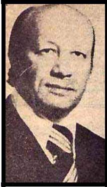
علی اکبر طباطبائی

قاتل طباطبائی، دیوید بلفیلد، معروف به داوود صلاح‌الدین، ۱۱۰ به تهران فرار کرده و با استقبال گرمی روبرو شد. بلفیلد که یک آمریکایی آفریقایی تبار بود و مسلمان شده بود، در اواخر دهه ۱۳۵۰ در جرگه فعالان طرفدار خمینی درآمد و از آن زمان تاکنون به کرات جزئیات قتل و نیز روابطش با نمایندگان جمهوری اسلامی ایران را شرح داده است. ۱۱۱ در سال ۱۳۸۵، در مصاحبه‌ای که در فیلمی مستند به نام «فراری آمریکایی» نشان داده شد، صلاح‌الدین با خونسردی شرح داد «هنگامی که [طباطبائی] برای امضاء دم در آمد، من به او شلیک کردم. به همین سادگی». ۱۱۲