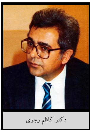
دکتر کاظم رجوی

ایران در سازمان ملل در ژنو در برابر چندین شاهد به دکتر رجوی اخطار کرد: «ما تو را خواهیم کشت». ۲۴۸ دکتر رجوی فقط چند هفته پس از آن به قتل رسید.