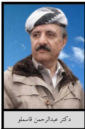
دکتر عبدالرحمن قاسملو

به عنوان میانجی عمل می کرد، در طی ملاقاتی محرمانه با نمایندگان حکومت ایران در آپارتمانی در وین به قتل رسیدند. ۱۹۳